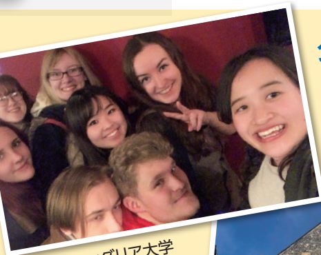
イーストアングリア大学 (イギリス)の友人たち