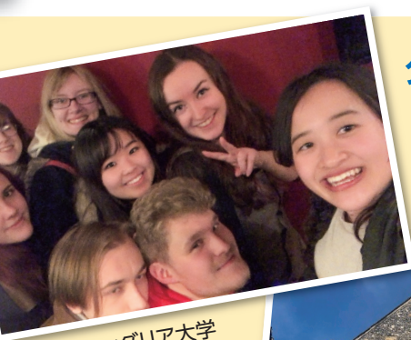
イーストアングリア大学 (イギリス)の友人たち